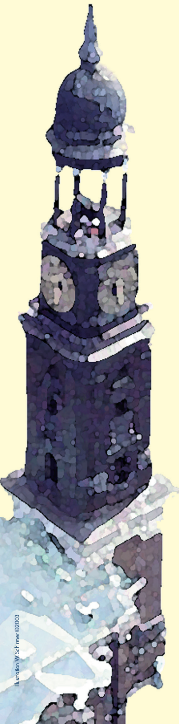
Illustration W. Schirmer ©2003